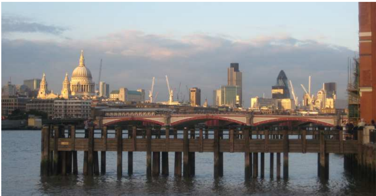
Widok Londynu od strony Tamizy – zmiana charakteru miasta poprzez zmianę charakterystycznych elementów jego zabudowy.

Warty podkreślenia jest obraz szczecińskiego Manhattanu, gdzie jak do tej pory nad miastem góruje gmach telewizji oraz kompleks budynków Radisson. Idealnym rozwiązaniem jest dopełnienie kompozycji dwiema lub trzema ikonami architektury. W śródmiejskim Szczecinie przeważają dziewiętnastowieczne pięciokondygnacyjne kamienice, wzbogacone historycznymi detalami. Jedynymi akcentami wysokościowymi w tej tkance są dziesięciopiętrowe budynki mieszkalne. Elementem stanowiącym akcent w tkance miejskiej i jednocześnie będące punktem odniesienia dla podróżnych mających trudności z orientacją w gwiaździstym układzie ulic byłyby