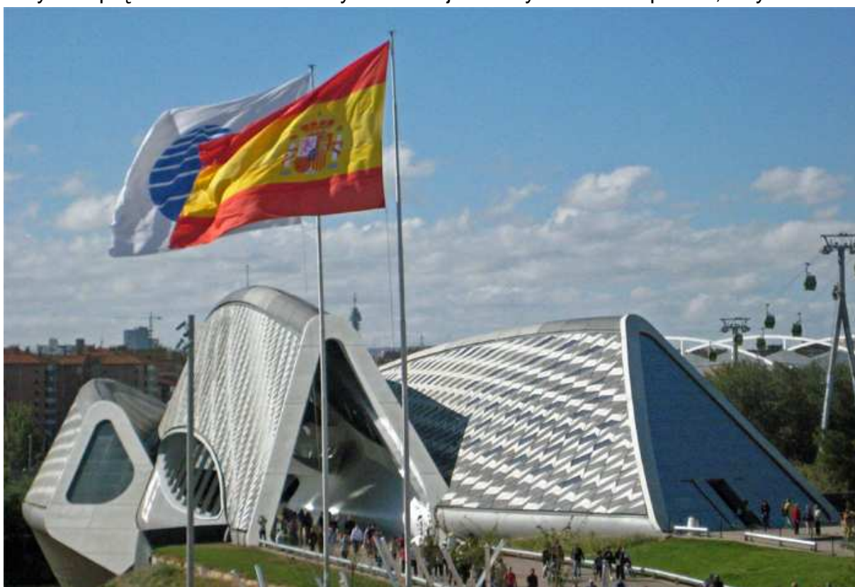
Pawilon Hahy Hadid zbudowany podczas Expo w Saragossie

Czy czerpiąc z doświadczeń innych miast jesteśmy w stanie sprawić, aby Szczecin