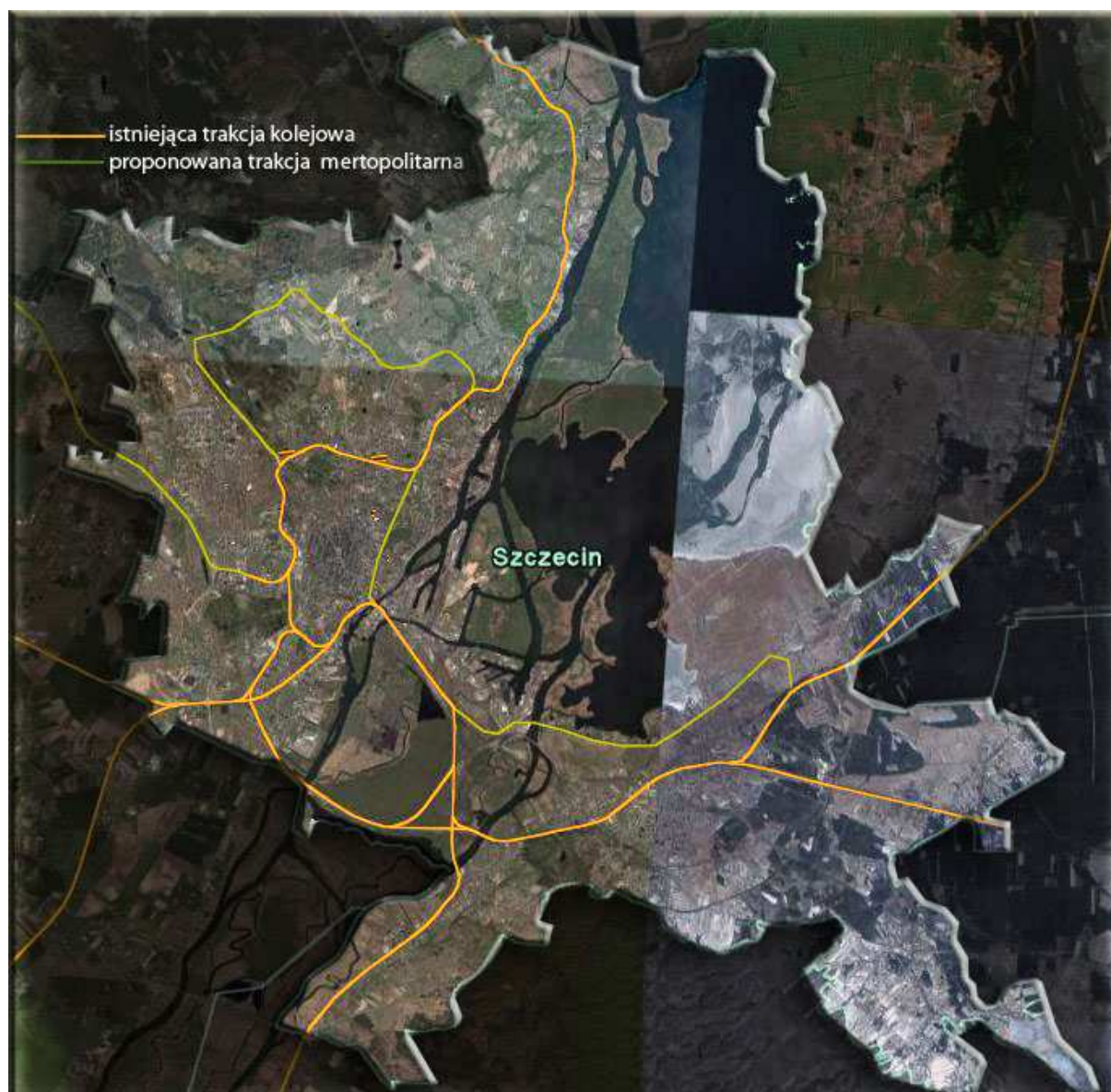
Lokalizacja istniejącej infrastruktury kolejowej w Szczecinie oraz proponowany rozwój sieci metropolitarnej.

Szczecin został nazwany miastem zieleni, natomiast większość mieszkańców nie ma okazji korzystać z takich walorów terenów zielonych jak wyspy położone pomiędzy jeziorem i rzeką, oraz tereny leśne z powodu nie rozwiązanej infrastruktury pieszo-jezdnej. Skomunikowanie wysp zlokalizowanych pomiędzy Jeziorem Dąbie i Odrą-Regalicą poprzez poprowadzenie tunelu pod rzeką z wkomponowanymi we wnętrze tymczasowymi wystawami czy akwariem lub nowatorsko rozwiązaniem