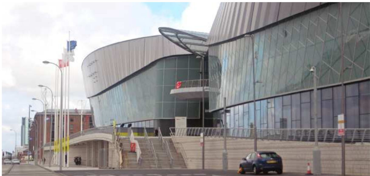
Zespół sportowo – kulturalny w Liverpoolu